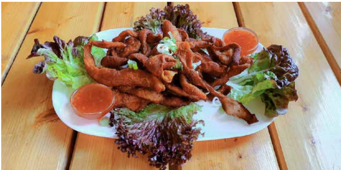
Schweine-Krustis mit Dips *A,G,I,3,5,7 € 4,80