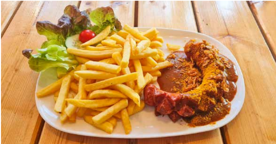
Currywurst mit Pommes *4,5 € 7,50